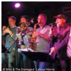
© Biko & The Damaged Labour Horns

Satte Sounds, kräftige Bläsersätze, soulige Stimmen und groovige Rhythmen!